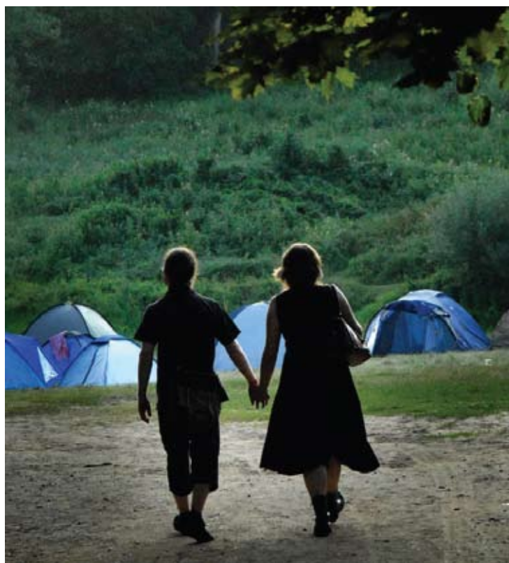
Rūpestingieji dėdės ir tetos „gelbsti“ vaikus.