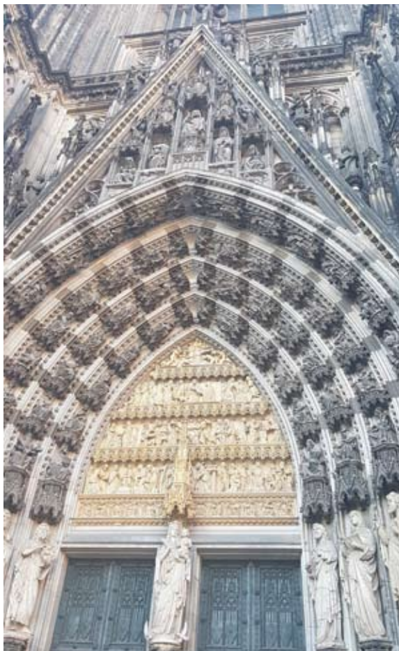
Kelno katedros aukštis - 157 metrai. Tolerantiškieji vokiečiai Kelno katedroje įrėngė vietą melstis musulmonams, kurių šiame mieste kasmet vis daugėja.