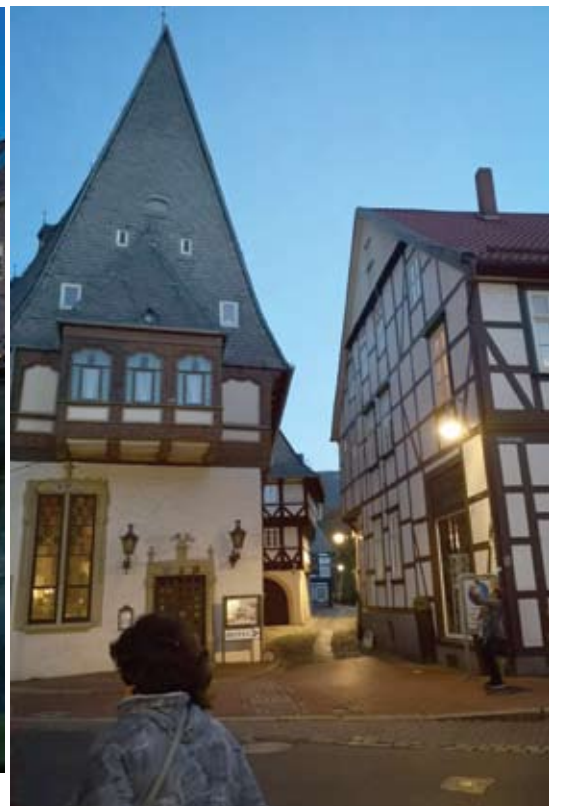
Goslaras - vientisas fachverko architektūros stiliaus miestas.