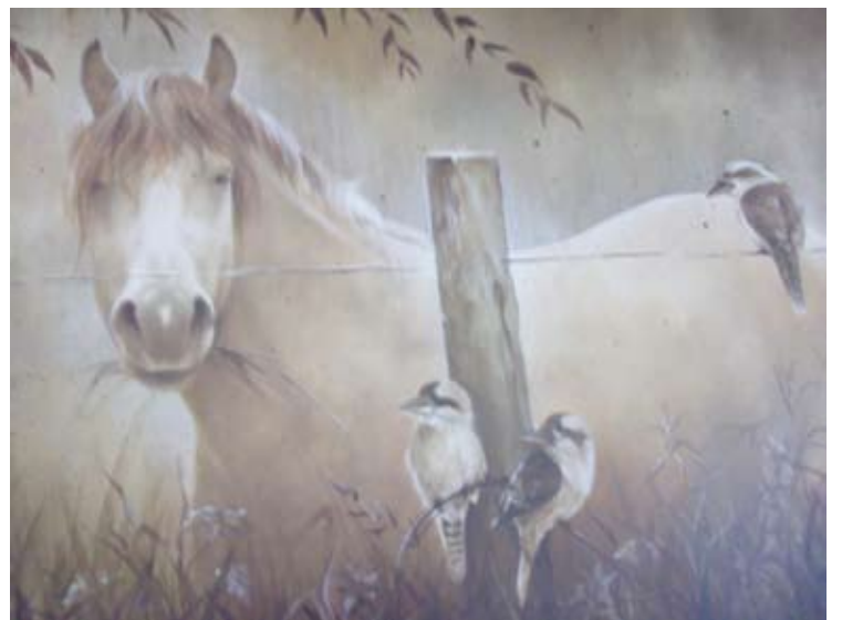
Žirgų pasaulio mistika.