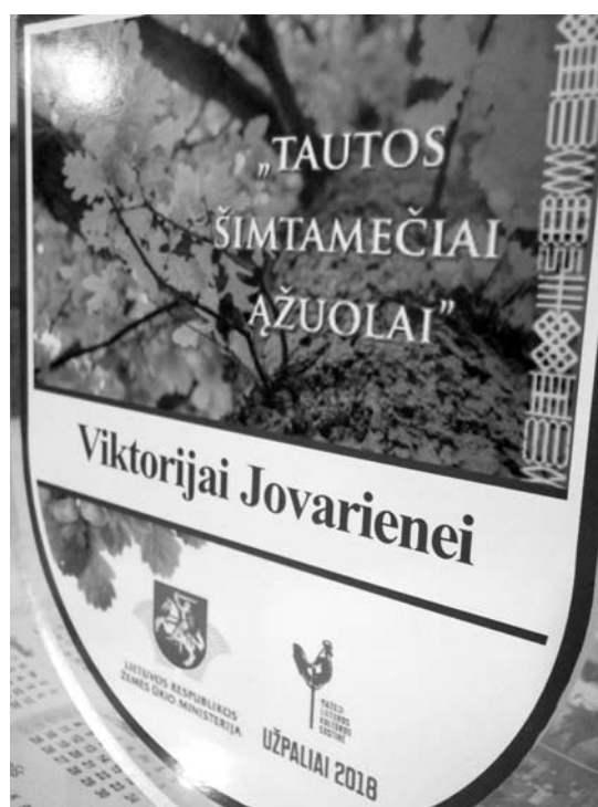
Stelmužės ažuolo palikuonio, klonuoto Šimtmečio ažuolėlio lydraštis.