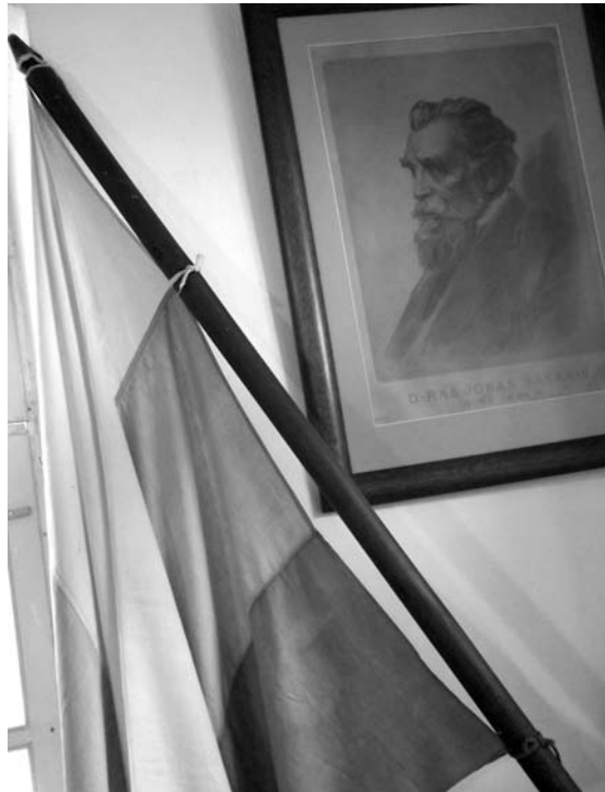
Išsaugotos relikvijos - tarpukario lietuviška trispalvė ir dr. Jono Basanavičiaus portretas.