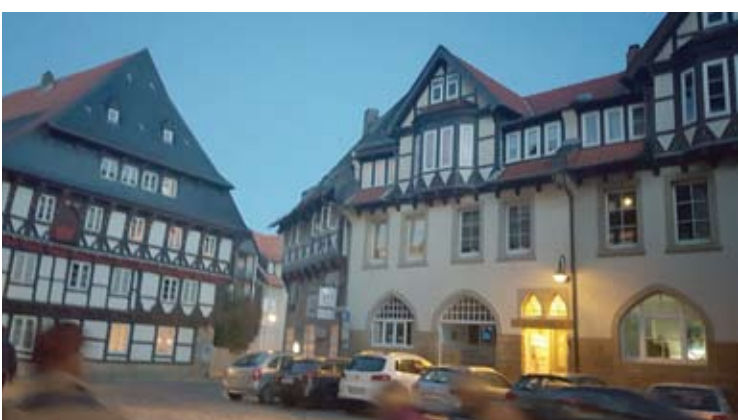
Tūkstantmetį Goslarą nuo Antrojo pasaulinio karo bombų apsaugojo turbūt magiškos jėgos. Miestas nė kiek nebuvo sugriautas.

Vakare retai kuriame Goslaro senamiesčio lange dega šviesos. Pamenu, kartą gidė viename, matyt, nepigiam Paryžiaus kvartale rodė ranka, kur Madonos, kur Švarcnerio, kur kitų labai jau žinomomis pavardėmis žmonių būstai. Tuomet girdečiau, jog dalis būtų šeiminių juose apskritai niekad nėra buvę. Goslare, sako, yra panašiai. Siemensai galėtų šiame mieste susirasti nemažai žmonių, su kuriais ir jiems drauge vakaroti būtų prestižiška... Tiesa, matyt, prieš keletus metus iki susitikimo reikėtų derinti grafikus, kad įžymybės tuo pat metu atvyktų į Harco kalnų papėdėje murksantį miestelį.