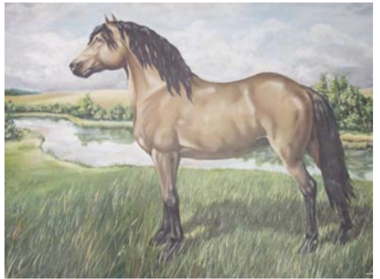
Paveiksle - lankose prie Šventosios besigananti žemaitukė.