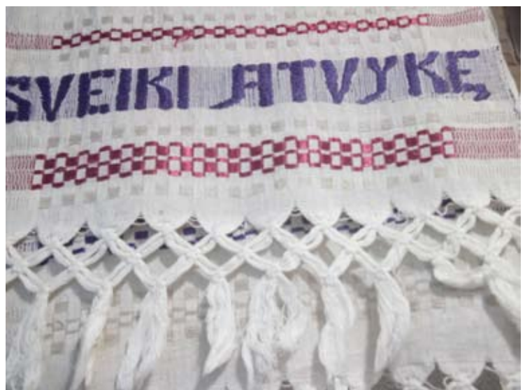
Šimtmečio didžiųjų rankšluosčių - abrūsų - žavesys ir grožis.